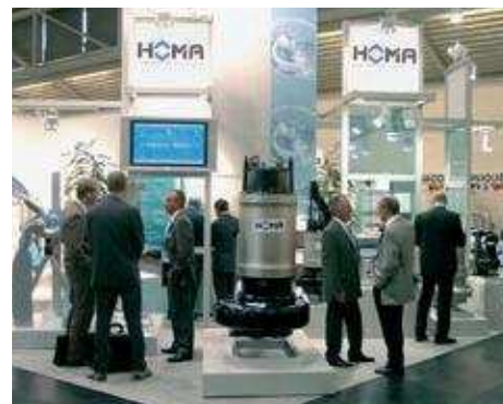
НОМА на интернациональных выставках: во всём мире рядом со всеми потребителями.