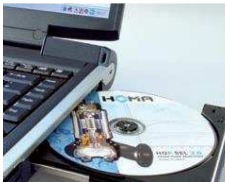
Программы по настройке можно скачать через интернет или получить на компактном диске.