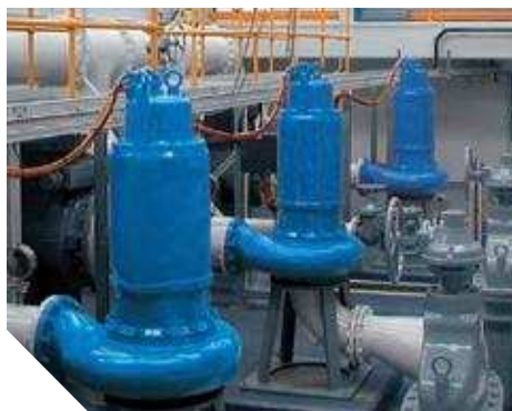
Канализационные насосные станции с погружными двигателями для сухой установки.